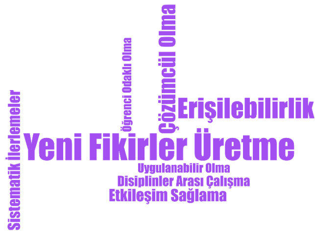
Şekil 4: Önerilerin frekans kod bulutu.

Katılımcıların önerilerine ilişkin temada bulunan kodlar yeni fikirler üretme (f:30), erişilebilirlik (f:22), çözümcül olma (f:17), etkileşim sağlama (f:12), sistematik ilerlemeler (f:11), disiplinler arası çalışma (f:9), uygulanabilir olma (f:8), öğrenci odaklı olma (f:7), kolaylaştırıcı olma (f:5), geri dönüşler alma (f:2), aile katılımı (f:1) şeklindedir.