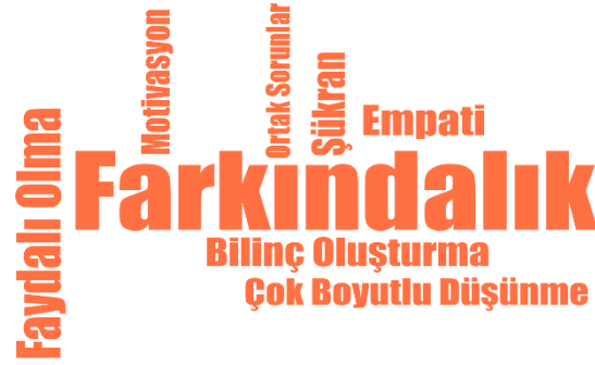
Şekil 2: Duygu ve düşüncelerin frekans kod bulutu.

Katılımcıların duygu ve düşüncelerine ilişkin temada bulunan kodlar farkındalık (f:40), faydalı olma (f:14), empati (f:9), bilinç oluşturma (f:8), şükran (f:8), çok boyutlu düşünme (f:7), motivasyon (f:6), ortak sorunlar (f:3), pozitif ayrımcılık (f:1), eşitlik (f:1), adalet (f:1) şeklindedir.